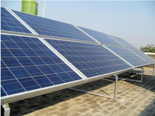
निकाय कार्यालय को वैकल्पिक उर्जा पर निर्भर करने हेतु में सोलर पवार प्लांट लगाने की योजना।

नगर निगम परिसर में 14वें वित्त आयोग एवं नगर निगम निधि से 20 किलो वाट क्षमता के सोलर प्लांट को स्थापित करने हेतु कार्यवाही आरंभ की गयी, जिसका उद्देश्य नगर निगम कार्यालय की सम्पूर्ण विद्युत व्यवस्था को प्रदूषण रहित स्वच्छ उर्जा, सौर उर्जा आधारित करना है। इस योजना पर कार्य हेतु नगर निगम कार्यालय में विद्युत की मांग तथा खपत की गणना हेतु सर्वेक्षण कार्य पूरा किया जा चुका है, इस योजना के अंतर्गत ही नगर निगम कार्यालय में प्रयुक्त हो रहे सामान्य विद्युत उपकरणों को एल.ई.डी. तथा अन्य कम विद्युत आवश्यकता वाले उपकरणों से बदला जायेगा। नगर निगम परिसर में उक्त 4-6 घंटे बैकअप वाले 20 किलो वाट क्षमता के सोलर पवार प्लांट को 5 वर्ष की एएमसी के साथ स्थापित करने हेतु स्थान का चयन भी किया जा चुका है।