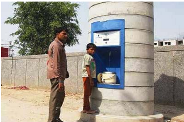
सहारनपुर नगर निगम की आर.ओ. वाटर एटीएम लगाकर पेयजल उपलब्ध करने की योजना।

स्मार्ट सिटी सहारनपुर को स्मार्ट सिटी के रूप में विकसित करने हेतु नगर निगम सहारनपुर ने जनसुविधायें बढ़ाने के क्रम में नगरवासियों को सस्ती दरों पर आर.ओ. वाटर