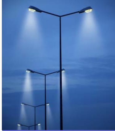
सहारनपुर नगर निगम की ओर से सामान्य स्ट्रीट लाइट को एल.ई.डी. लाइट से बदलने का अभियान।

पर कुल ..... एल ई डी लाइट लगा कर नगर निगम ने लगभग बिजली के बिल के रूप में लगभग ..... लाख रुपये प्रति माह की बचत की है। इस अभियान में ..... वाट की सोडियम लाइटों को ..... वाट की एल. ई. डी लाइटों से बदला जा रहा है। शीघ्र ही नगर के अन्य प्रमुख मार्गों को विभिन्न चरणों में एल. ई. डी लाइटों से सुसज्जित किया जायेगा। नगर निगम शीघ्र ही गली, मोहल्लों तथा कालोनियों के साथ ही साथ नगर निकाय कार्यालय को भी एल. ई. डी. लाइट से प्रकाशित करने हेतु योजना बना रहा है।