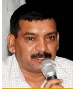
डा० नीरज शुक्ला नगर आयुक्त

हर वर्ष की भांति इस वर्ष भी नगर निगम ने रमजान माह पर पथ प्रकाश, जल आपूर्ति व साफ-सफाई की विशेष व्यवस्था की है, जिससे नागरिकों को असुविधा का सामना न करना पड़े।